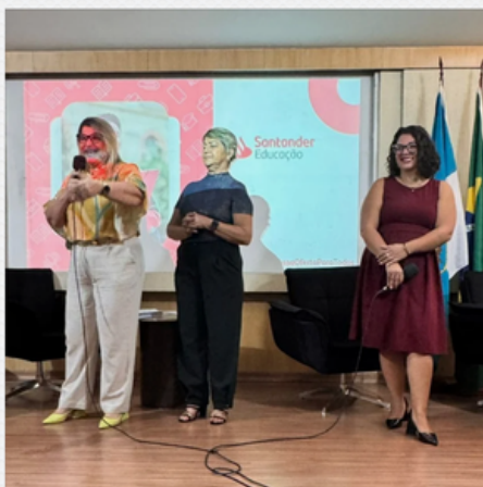
WORKSHOP CAFÉ & RPPS SANTANDER ASSET