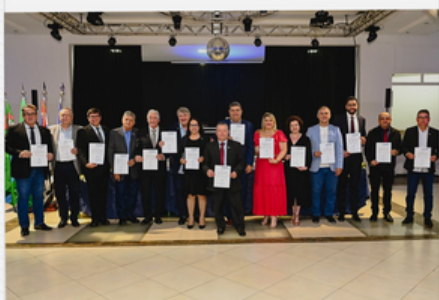
POSE DIRETORIA ABIPEM