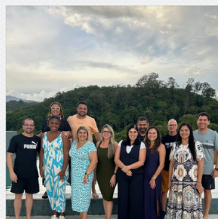
CONFRATERNIZAÇÃO AEPREMERJ DIRIGENTES DE RPPS