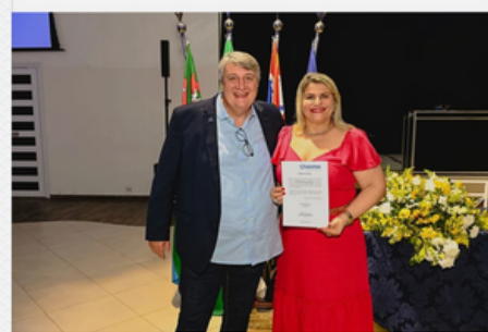
POSSE DIRETORIA ABIPEM