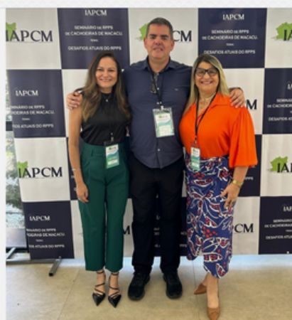
I SEMINÁRIO DE RPPS - CACHOEIRAS DE MACACU