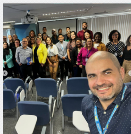
3º SEMINÁRIO SEG SUL FLUMINENSE CAIXA ECONÔMICA FEDERAL