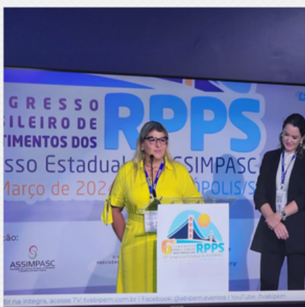
6º CONGRESSO BRASILEIRO DE INVESTIMENTOS DOS RPPS ABIPEM