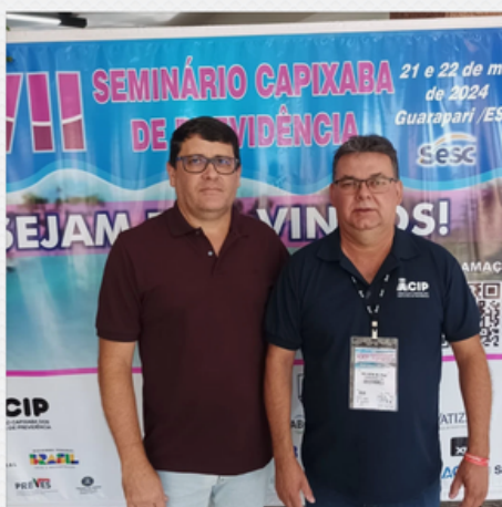
XVII SEMINÁRIO CAPIXABA DE PREVIDÊNCIA