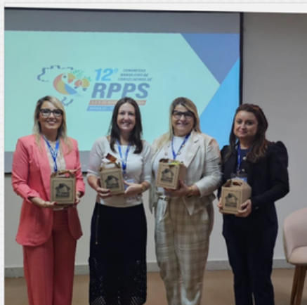
12º CONGRESSO BRASILEIRO DE CONSELHEIROS DE RPPS