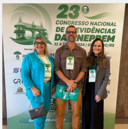
23º CONGRESSO NACIONAL DE PREVIDÊNCIAS DA ANEPREM