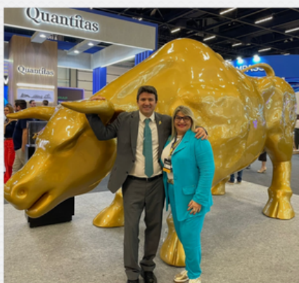
EXPERT XP 2024