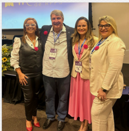
2º CONGRESSO BRASILEIRO DE MULHERES DE RPPS