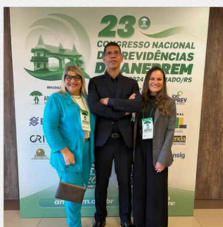
23º CONGRESSO NACIONAL DE PREVIDÊNCIAS DA ANEPREM