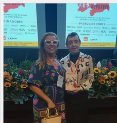
V CONGRESSO ESTADUAL DE PREVIDÊNCIA DA ASPREVPB