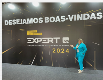
EXPERT XP 2024