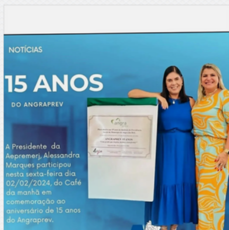
15 ANOS DO ANGRAPREV

A AEPREMERJ se mantém como um agente ativo na promoção de melhorias que beneficiem todos os envolvidos na previdência.