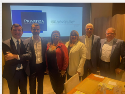
30 ANOS DO PLANO REAL PRIVATIZA AGENTES AUTÔNOMOS DE INVESTIMENTOS