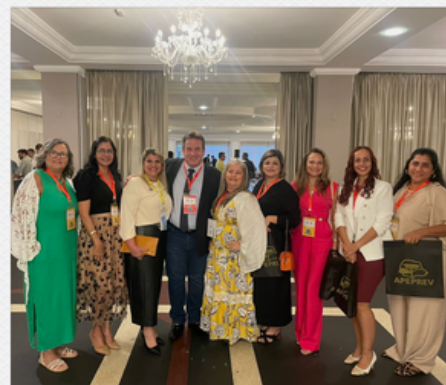
CONGRESSO APEPREV RPPS 2024 O QUE FAZER?