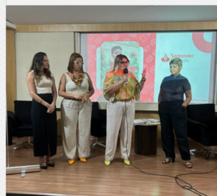
WORKSHOP CAFÉ & RPPS SANTANDER ASSET