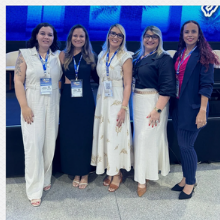
12º CONGRESSO BRASILEIRO DE CONSELHEIROS DE RPPS