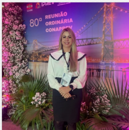
80ª REUNIÃO CONAPREV