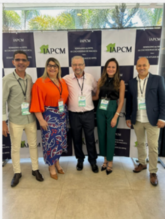
I SEMINÁRIO DE RPPS - CACHOEIRAS DE MACACU