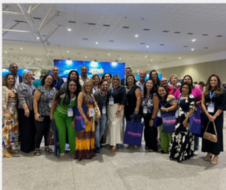
12º CONGRESSO BRASILEIRO DE CONSELHEIROS DE RPPS