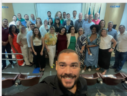
WORKSHOP CAFÉ & RPPS SANTANDER ASSET