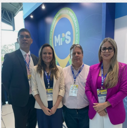
57º CONGRESSO NACIONAL DA ABIPEM