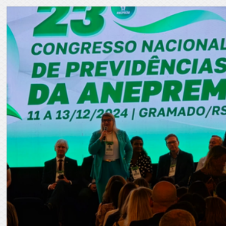
23º CONGRESSO NACIONAL DE PREVIDÊNCIAS DA ANEPREM