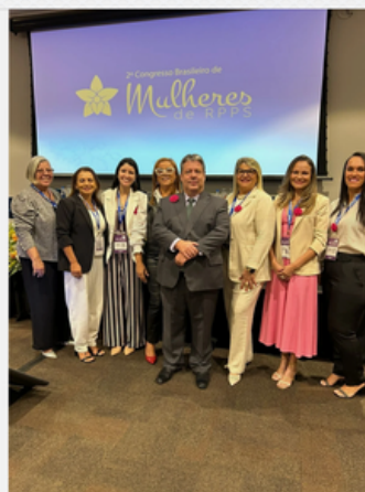
2º CONGRESSO BRASILEIRO DE MULHERES DE RPPS