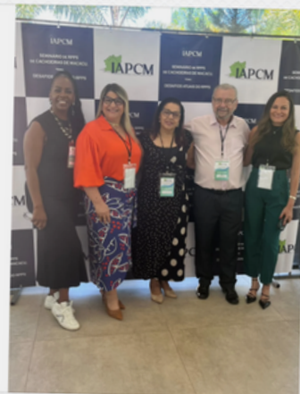
I SEMINÁRIO DE RPPS - CACHOEIRAS DE MACACU